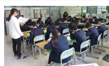
6年生：中学校入学説明会の説明を真剣に聞いています。