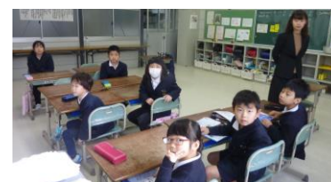
2年生：お手紙を配ります。