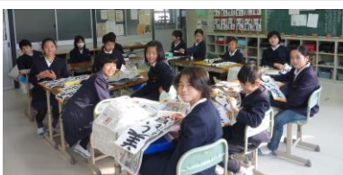
5年生：新聞社の取材を受けました。今日の夕刊でしょうか？