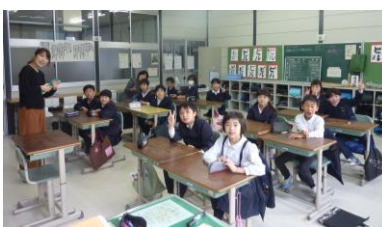
3年生：みんなでハイポーズ！