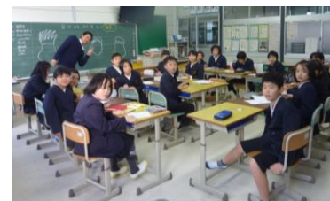
4年生：みんなで一緒に！