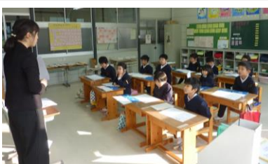
1年生：先生のお話です。

全員が5分前集合でき、とても静かに集合しました。集まってくる態度も整然としており、話を聞く態度も、話す人の方をしっかりと見て聞くことができました。さすが中正っ子です！