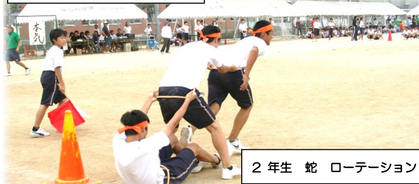
2年生 蛇 ローテーション