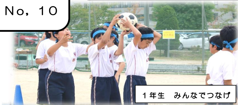
1年生 みんなでつなげ

今年度は体育館の改修工事のため、グラウンド等、制約がある厳しい状況の中での体育会となりますが、第42回の体育会が、津山東中の新たな1ページとなるように、ひとつひとつの行動により心を込めて、本気で頑張っていきましょう!!