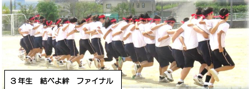
3年生 結べよ絆 ファイナル