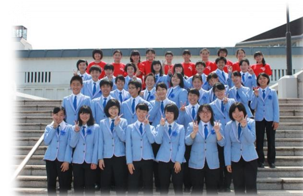
吹奏楽祭(吹奏楽部)