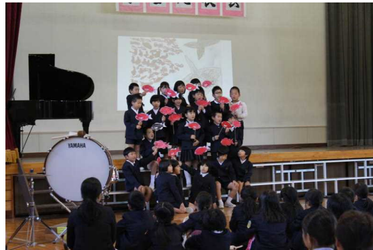
昨年の「学習発表会」2年生 スイミー

保護者・地域の皆様、昨年度と同様に、今年度もご理解・ご支援をよろしくお願いいたします。地域とともにある学校づくりに尽力してまいります。