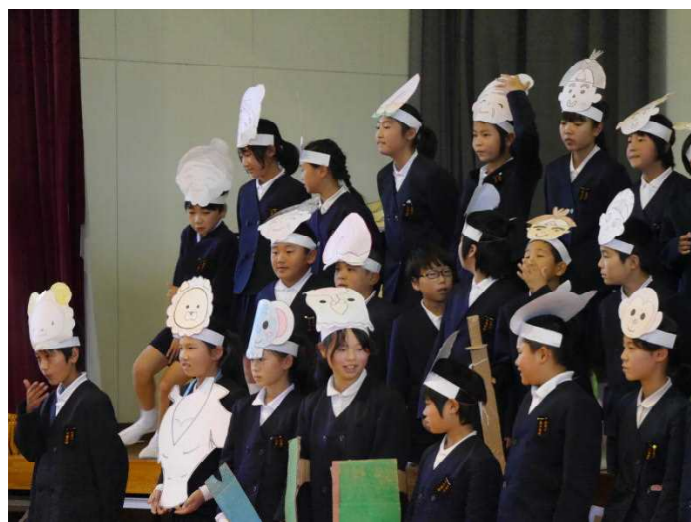
昨年の「学習発表会」5年生 「peach boy」

保護者・地域の皆様、昨年度と同様に、今年度もご理解・ご支援をよろしくお願いいたします。地域とともにある学校づくりに尽力してまいります。