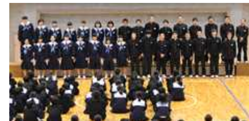
3年1組 「ふるさと」(最優秀賞)