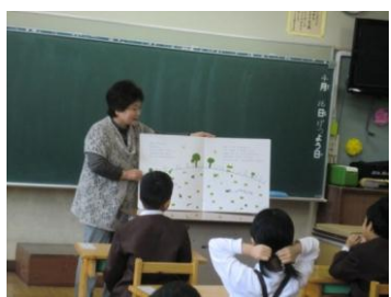
読み聞かせボランティア