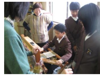
ふるさと学習 (倭文織り体験)

めざす学校像 子どもと教職員が共にかがやく学校 ～一人一人が自分のよさを発揮できる学校をめざして～