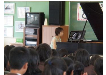
ベビッシュタイムコンサート

めざす学校像 子どもと教職員が共にかがやく学校 ～一人一人が自分のよさを発揮できる学校をめざして～